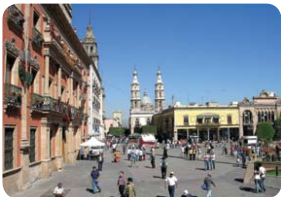
Centro histórico de León, Gto.

Estas interrogantes son el punto de partida para el XII Congreso Nacional de AMPAG , un espacio de diálogo y reflexión sobre el desarrollo del psicoanálisis desde su fundación y los retos que hoy enfrentan su corpus teórico y la práctica clínica. Participan como co-gestores del Congreso la Universidad Iberoamericana León (UIA), la Sociedad de Psicoterapia y Psicoanálisis del Centro, A.C (SOPAC) y La Escuela Grupal, A.C. (LEGRAC).