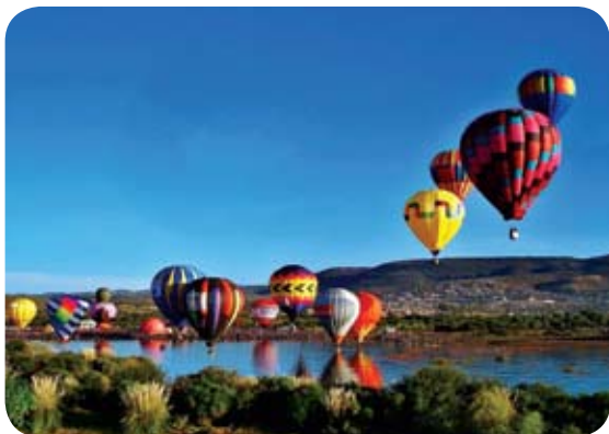
Evento anual de globos aerostáticos en el Parque Metropolitano en León, Gto.

AMPAG ofrece entrenamiento como Psicoterapeuta Psicoanalítico para terapia individual y de grupo, con validez de maestría registrada ante la SEP. Cuenta con dos de los centros de atención psicoterapéutica más grandes de Latinoamérica, cuya labor se rige por tres ejes: asistencia a la comunidad, apoyo a la formación de psicoterapeutas y fomento de la investigación.